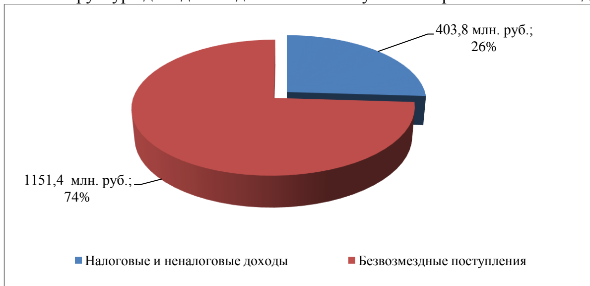
Структура доходов бюджета МО «Ахтубинский район» за 2021 год

Доля налоговых и неналоговых доходов в общих доходах бюджета МО «Ахтубинский район» составила 26,1 %, безвозмездных поступлений 73,9 %.