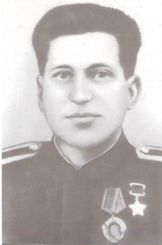
Младший сержант Максим Георгиевич БОЧАРОВ (1916 – 1971)

Удостоен звания Героя Советского Союза за прорыв обороны гитлеровцев севернее г. Рыльска, 1943 г.