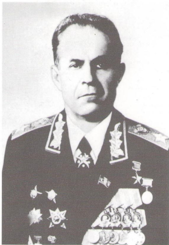
Маршал Советского Союза Сергей Федорович АХРОМЕЕВ (1923 – 1991)

Удостоен звания Героя Советского Союза за заслуги перед Отечеством, 1982 г.