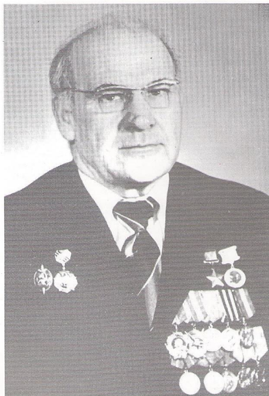
Ефим Максимович НИХАЕВ (1913 – 1979)

Удостоен звания Героя Советского Союза за мужество и героизм, проявленные в боях на территории Прибалтики, 1945 г.