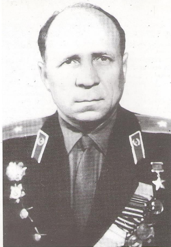
Майор Александр Максимович МЕРКУШЕВ (1918 г. р.)

В звании старшего лейтенанта за мужество и героизм, проявленные в сражениях с немецко-фашистскими захватчиками на территории Белоруссии, удостоен звания Героя Советского Союза, 1945 г.