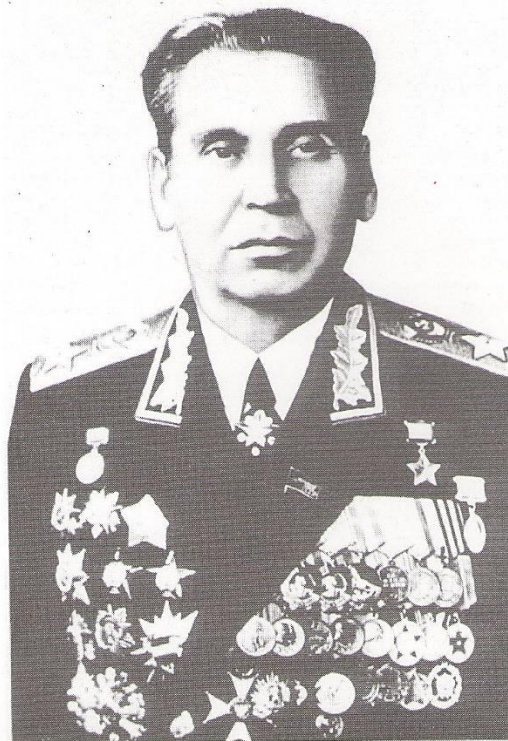
Маршал Советского Союза Николай Васильевич ОГАРКОВ (1917 г. р.)

Удостоен звания Героя Советского Союза за заслуги перед Отечеством, 1977 г.