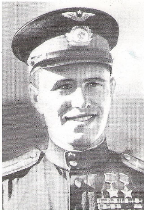
Капитан Николай Михайлович СКОМОРОХОВ (1920 – 1994)

Дважды Герой Советского Союза. Провел 119 воздушных боев, в которых лично сбил 46 самолетов противника, 1945 г.