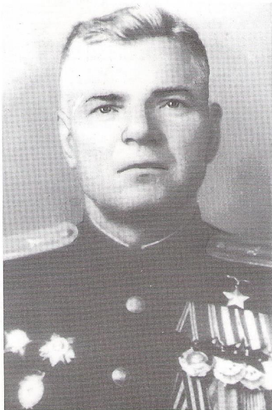
Майор Георгий Яковлевич ПЯТКИН (1908 – 1963)

Удостоен звания Героя Советского Союза за мужество и героизм, проявленные при форсировании р. Днепр, 1943 г.