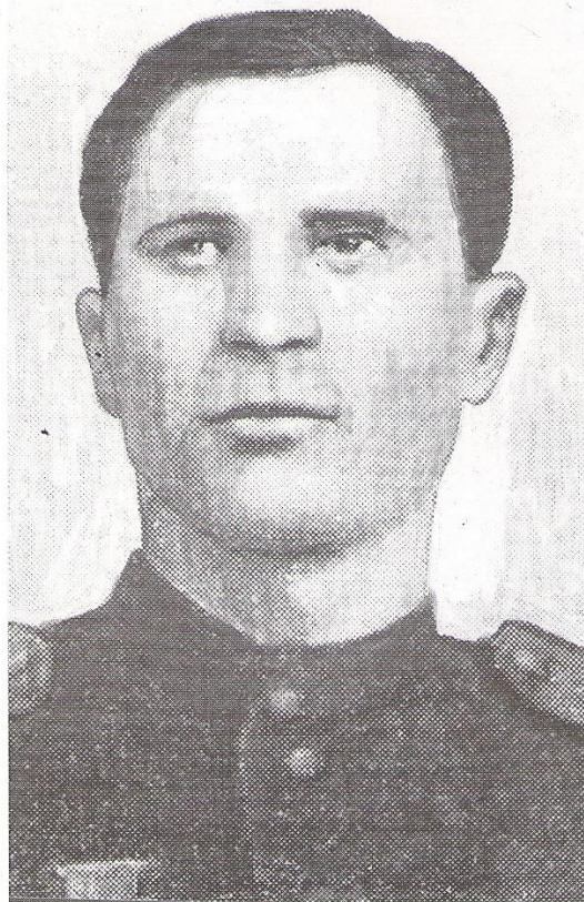
Гвардии лейтенант Иван Никитич СЫТОВ (1916 – 1943)

Удостоен звания Героя Советского Союза за мужество и героизм, проявленные в боях с гитлеровскими захватчиками, 1943 г.