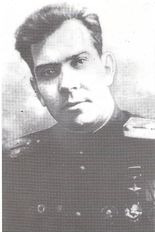
Гвардии старший лейтенант Михаил Иванович СЕМЕНЦОВ (1917 – 1945)

Удостоен звания Героя Советского Союза за совершенные 270 боевых вылетов и огненный таран на астраханском направлении, 1943 г.