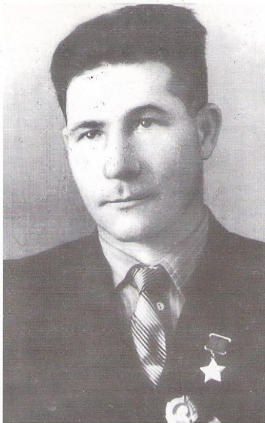
Петр Иванович ТАТАРЧЕНКОВ (1925 г. р.)

Удостоен звания Героя Советского Союза за мужество и героизм, проявленные при форсировании р. Одер, 1945 г.